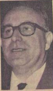
Il Presidente Rumor